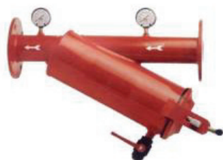
Filtro de lamelas em linha

Filtro metálico com tratamento anti-corrosivo