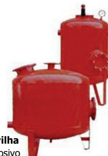
Filtro de gravilha

Filtro metálico com tratamento anti-corrosivo