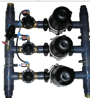
Cabeçal de filtragem lamelas