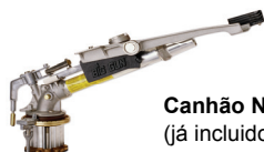
Canhão Nelson (já incluído numa máquina T ou E)

UPGRADE PARA ECOSTAR 4200 COM CAIXA SMS 4210